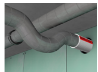
Zulässiger Einbau in raumabschließende Bauteile ohne notwendige Brandschutzklappen.