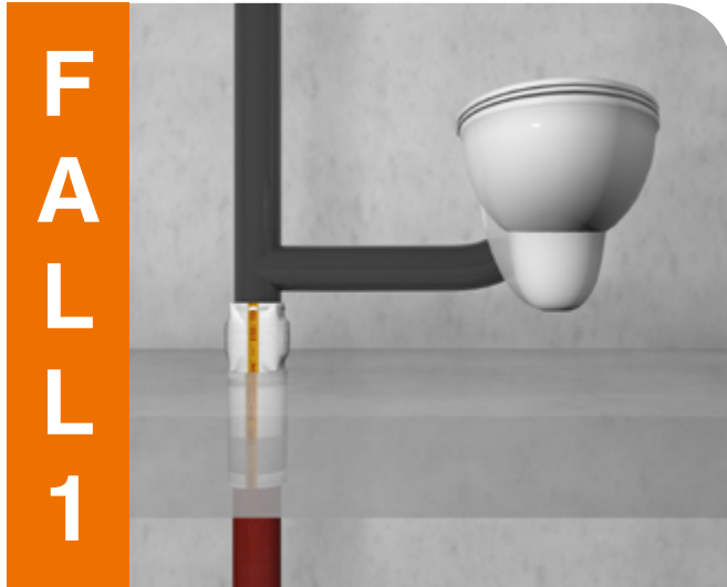
Gusseiserne Fallleitung wechselt auf Kunststoffrohr.

Deckendurchführung mit senkrechtem Übergang.