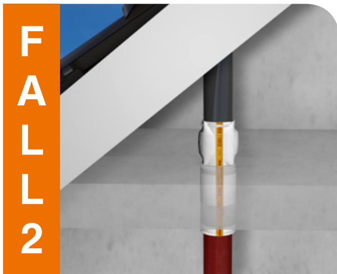
Weiterführende Entlüftungsleitung mit Kunststoffrohr.