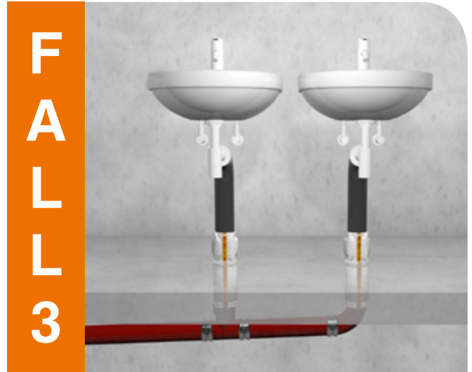
Materialwechsel bei Anschlussleitungen.