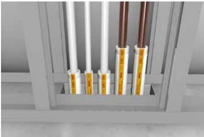
Missel Brandschutz-Dämm-Manschette BSM-R90

Schmale, platzsparende Lösung mit Brand-, Schall- und Feuchteschutz