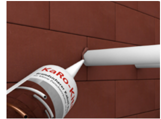
Beidseitige Verfüllung 20 mm tief