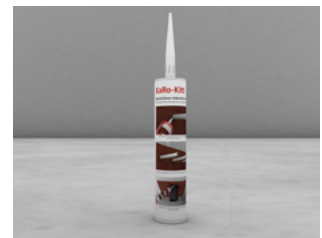
In der 310 ml Silikonkartusche