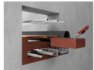
Stein-Zuschnitt für Kombischott