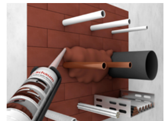
KaRo-Stein und KaRo-Schaum