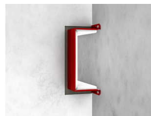
an der Wand durch die Wand