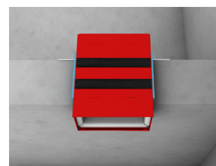
F90-Decke: Massivdecken d \geq 150 mm, symmetrisch F90-Decke: Massivdecken d \geq 200 mm, symmetrisch, asymmetrisch