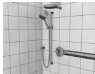
Stockwerkszuleitungen und Einzelzuleitungen in Vorwandinstallationen