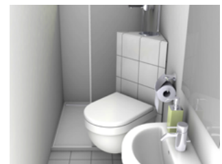
Schlauchbad – beengte Platzverhältnisse